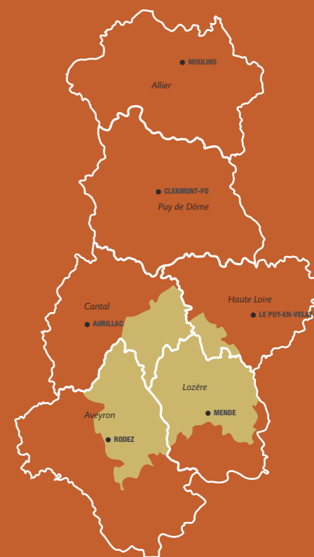
Aire de production de l'IGP Génisse Fleur d'Aubrac