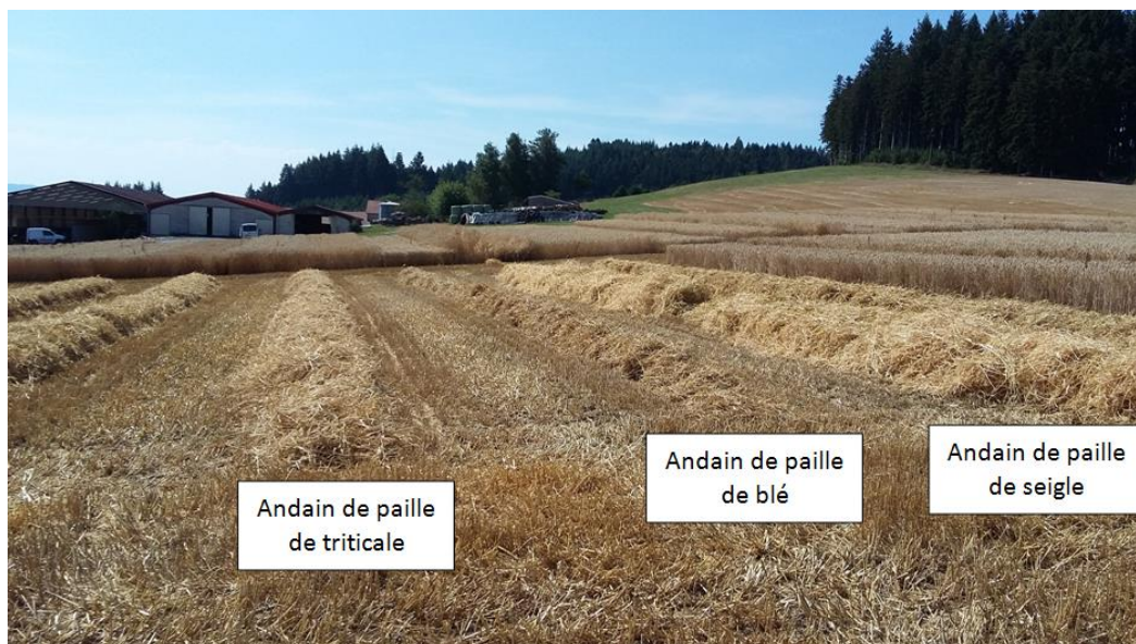
Photo moissons essais variétés céréales Marsac en Livradois

Enfin, les seigles sont les céréales les plus rustiques qui supportent bien les terres acides et superficielles. Ils produisent une quantité importante en paille et ont de faibles besoins en azote. Limiter l'apport d'azote minéral à 50 U/ha pour éviter les risques de verse. Seul défaut, la forte sensibilité de cette céréale à l'ergot. Cette maladie s'exprime notamment en cas d'automne ou hiver doux et pluvieux. Il n'existe pas de traitement de semences ou de fongicide efficaces pour lutter contre l'ergot du seigle.